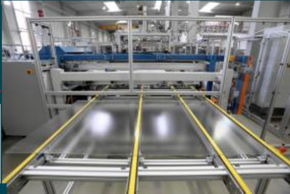
Einlaufband für gereinigte Glas-Substrate