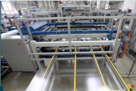
EVA-Folien-Sheeteer kombiniert mit Lift- & Richteinheit