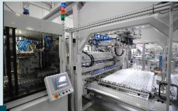
Direktintegration Stringer (Strings auflegen)